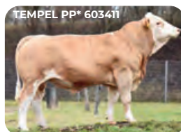
TEMPEL PP* 603411