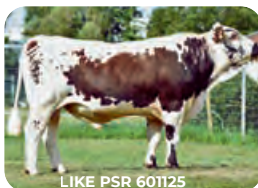
LIKE PSR 601125