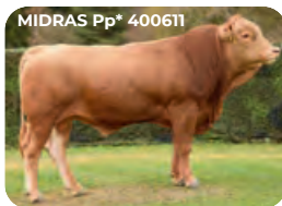
MIDRAS Pp* 400611