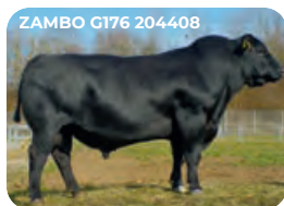
ZAMBO G176 204408

FAUN 1. Platz BRS Topliste Original pustertaler