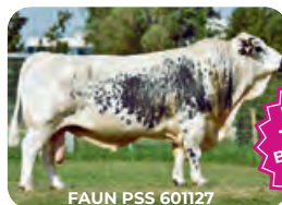
FAUN PSS 601127

FAUN 1. Platz BRS Topliste Original pustertaler