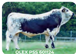
OLEX PSS 601124