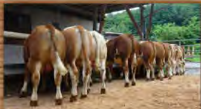
Zuchttier-Verkauf ganzjährig Bullen und weiblich Tiere

Z.u.B: Buck GbR 73345 Hohenstadt, Lindenhöfe 2