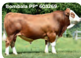
Bombala PP* 603269