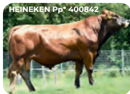
HEINEKEN Pp* 400842