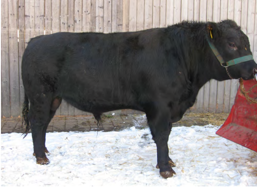
Katalognr. 16 - DE 09 88300083